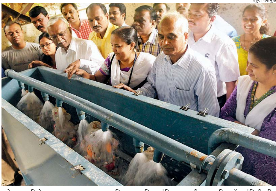
पुणे महापालिकेचा घनकचरा व्यवस्थापन विभाग, कमिन्स इंडिया, एनसीएल आणि मॉज इंजिनीअरिंग सिस्टिमसचे प्लास्टर ऑफ पॅरिसच्या गणेशमूर्ती विसर्जनासाठी पर्यावरणपूरक पद्धत विकसित करण्यात आल्यानंतर त्याचे प्रात्यक्षिक दाखविण्यात आले.

स्मार्ट सिटीसाठी निश्चित केलेल्या धोरणातील काही बाबींचा समावेश केंद्र सरकारकडे पाठविला. त्यावरून, सर्वदूर टिकेची झोड उठत असतानाच, त्याबाबत निर्णय घेण्याच्या सूचना केंद्र सरकारने राज्य सरकारला दिल्या होत्या. पुणे-पिंपरीचा संयुक्त प्रकल्प असला, तरी दोन्ही शहरांना निधी कमी पडू देणार नाही, अशी ग्वाही मुख्यमंत्री देवेंद्र फडणवीस यांनी नुकतीच दिली होती. या पार्श्वभूमीवर, पुणे-पिंपरीचा संयुक्त प्रस्ताव मान्य करतानाच, दोन्ही शहरांना स्वतंत्र निधी द्यावा, अशी मागणी राज्य सरकारने केंद्राकडे केली असल्याचे कळते. केंद्राने